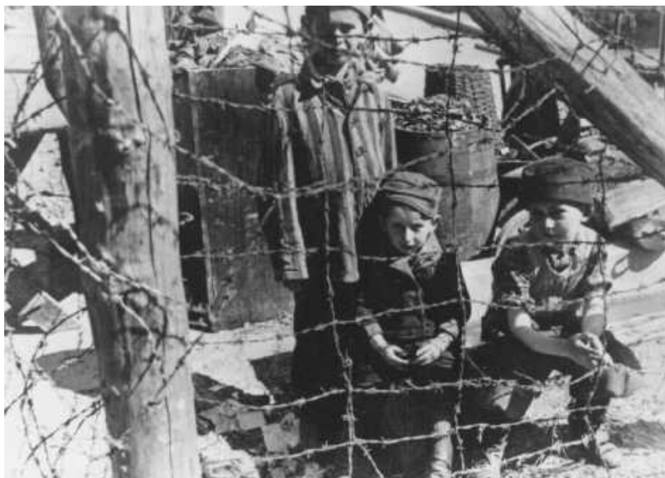
Buchenwaldský „dětský blok 66“ (zvláštní táborové budovy pro děti) krátce po osvobození. Německo, po 11. dubnu 1945.

V posledních měsících války přesunovaly dozorcí SS vězně z táborů vlakem nebo pěšky (nechvalně známé „pochody smrti“). Jejich cílem bylo zabránit osvobození velkého počtu vězňů spojeneckými silami. Po sérii útoků proti Německu postupovali Spojenci Evropou a začali osvobozovat vězně z koncentračních táborů a také ty, na které narazili při pochodech z jednoho tábora do druhého. Tyto pochody pokračovaly až do 7. května 1945, kdy se německé ozbrojené síly bezpodmínečně vzdaly Spojencům. Pro západní spojenecké síly oficiálně skončila 2. světová válka v Evropě již příštího dne, 8. května (Den vítězství v Evropě), zatímco sovětské ozbrojené síly prohlásily za svůj „Den vítězství“ 9. květen 1945.