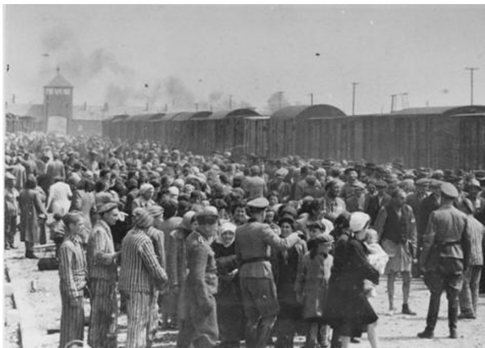
Židé z Podkarpatské Rusi během selekce na rampě koncentračního tábora Osvětim-Březinka

Holocaust bylo systematické, byrokratické, státem podporované pronásledování a vyvražďování přibližně šesti milionů Židů nacistickým režimem a jeho pomahači. „Holocaust“ je slovo řeckého původu vztahující se k „obětování ohněm“. Nacisté, kteří se v Německu dostali k moci v lednu 1933, byli přesvědčeni, že německý národ je „rasově nadřazený“ a že Židé, jež považovali za méněcenné, jsou přistěhovaleckým ohrožením rasové čistoty německé společnosti.