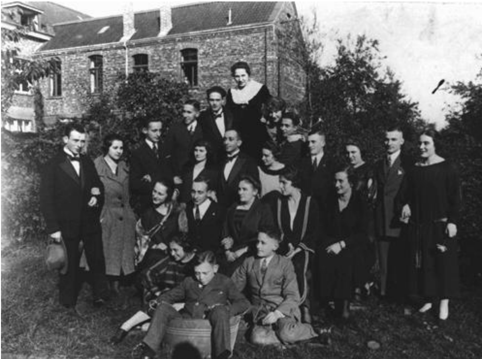
Setkání dvou židovských rodin v Německu před válkou. Z této skupiny přežili Holocaust pouze dva lidé. Německo, 1928.

V roce 1933 žilo v Evropě přes devět milionů Židů. Většina evropských Židů žila v zemích, které nacistické Německo během 2. světové války okupovalo nebo jinak ovlivnilo. Do roku 1945 zabili Němci a jejich pomahači dvě třetiny všech evropských Židů v rámci takzvaného „konečného řešení“, což byla nacistická politika vyvražďování Židů v Evropě. Ačkoli hlavními oběťmi nacistického rasismu byli Židé, které nacisté považovali za největší hrozbu pro Německo, mezi další oběti patřilo i přibližně 200 tisíc Romů (cikánů). Kromě toho bylo v rámci takzvaného Programu eutanázie zavražděno nejméně 200 tisíc mentálně nebo tělesně postižených pacientů převážně německé národnosti, kteří žili v ústavech.